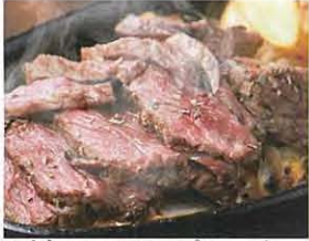
★人気No 1のランプステーキ

陸前高田市の食材をランド米「たかたのゆめ」に、愛知県産の「奇跡の一本松」を模したエビ天がのる天むす「金シャチむすび」は、エビを2尾使用した満足いっぱいになる一押しメニューです。