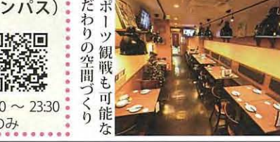
スポーツ観戦も可能なこだわりの空間づくり