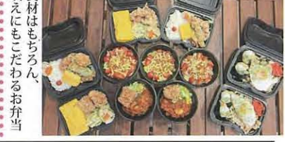
食材はもちろん、映えにもこだわってお弁当