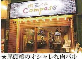
★尾頭橋のオシャレな肉バル

尾頭橋のオシャレな肉バル「肉菜バルCOMPASS」は、肉の食べ比べ（4種盛り合わせ）や、お通しに出している国産牛や希少部位を使った牛筋のビーフシチューを是非ともご賞味ください。