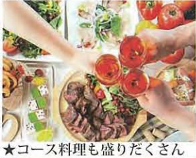
★コース料理も盛りだくさん