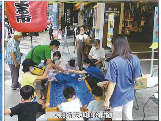
大須新天地通商店街