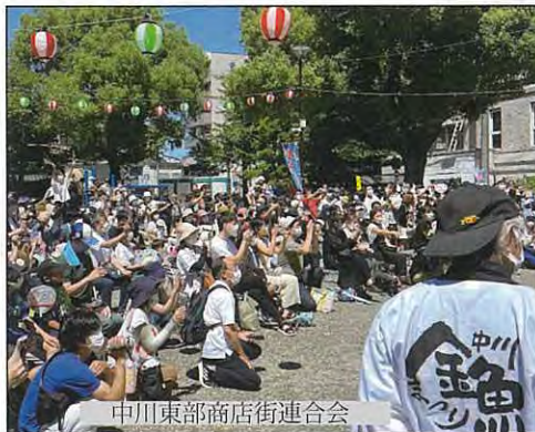
中川東部商店街連合会