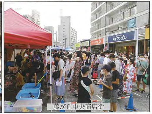
藤が丘中央商店街