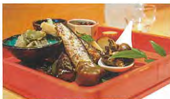
おすすめ、おぼんざい「鱧の生姜煮」

名古屋市中東区、藤が丘駅より徒歩3分ほどの地元の方にとっても愛されているお店をご紹介します。 紹介いたします。「海の台所 和食屋 一丁田」さんは2012年に創業されました。