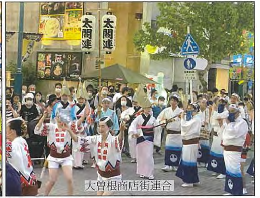
大曽根商店街連合