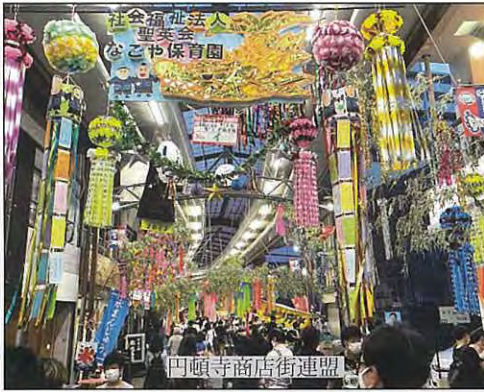
円頓寺商店街連盟