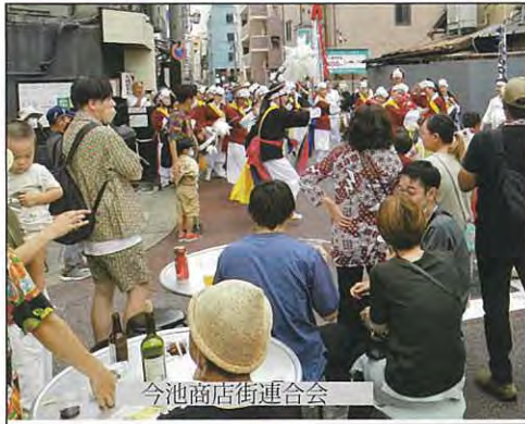
今池商店街連合会