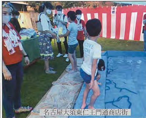
名古屋大須東仁王門通商店街