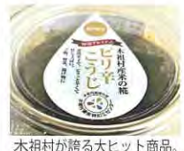
木曽村が誇る大ヒット商品。味噌より旨い!野菜にもグッド!「ピリ辛こうじ」430円(税込)

長野県木曽村は、自然豊かな木曾川の源流の地。下流域にある名古屋市との交流の縁あって、平成20年に木曽村観光協会の名古屋出張所を兼ねてオープンしました。