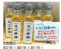
脳活!腸活!肌活!オメガ3とαリノレン酸たっぷり「えごま油」105g2,300円(税込)