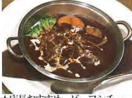
★店長おすすめ、ビーフシチュー

は2代目、大学卒業後当時急成長の大手外食産業チェーンに入社するが実家のお店の大繁盛と人手不足もあり25才の若さで父親の店を継いでいます。