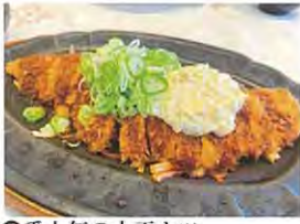
② 番人気の大正カツ