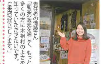
「商品の販売を通して、もっと多くの方に木曽村のよさを知っていただきたいです。ご来店お待ちしております。」

木曽村アンテナショップ 源気屋 桜山店 〒466-0044 名古屋市中区桜山町 6-104-37 アクセス 地下鉄桜山駅 7番出口すぐ Tel 052-680-7350 営業時間 10時~17時(木金は18時迄) 定休日 日曜日