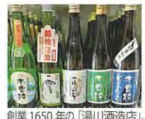
創業1650年の「湯川酒造店」。標高936mの立地を生かした味わいと余韻を楽しみたい!

「ピリ辛こうじ」。ピンがずりりと並びまリツとした甘辛さでご飯がとまりません。お店にならぶ商品には、体にやさしいものが目立ちます。リピーターさんが多いのが、αリノレン酸たっぷりの「えごま油」や美肌効果期待できる「米麴の甘酒」、期間限定の「林葉巻」、有名な「お六櫛」などの伝統工芸品も。冷蔵ケースには木曾路の日本酒やワイナリーなど、お洒落な品も。冷感ケースには木曾路の日本酒やワイナリーなど、お洒落な品も。冷感ケースには木曾路の日本酒やワイナリーなど、お洒落な品も。