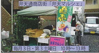
弁天通商店街「弁天マルシェ」 毎月3日・第3土曜日 10時～13時