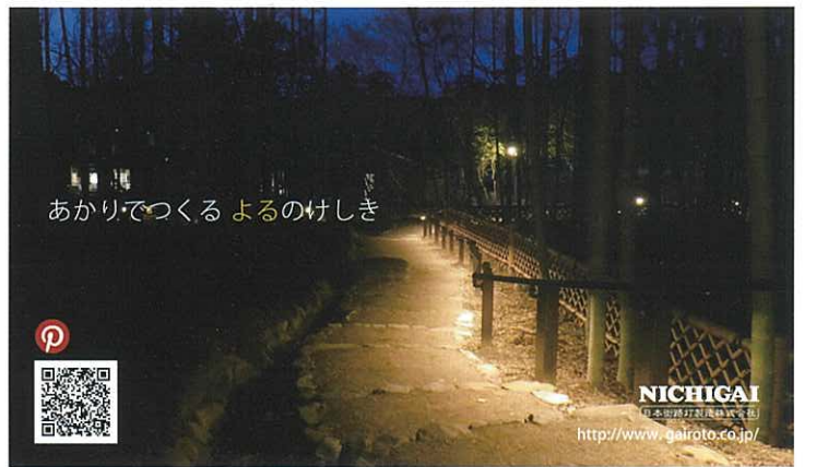
あかりでつくるよるのけしき