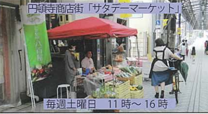
円頓寺商店街「サタデーマーケット」 毎週土曜日 11時～16時