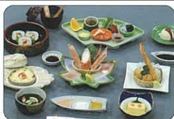
お昼のかに会席 北見枝幸 5,200円(税込)

少人数のご会食や親しい家族とお食事には ●お昼のかに会席 3,000円~7,200円(税込)6種 ●かに会席・かにすき会席 5,500円~13,000円(税込)12種 優雅な庭が楽しめる個室・掘席・椅子席多数