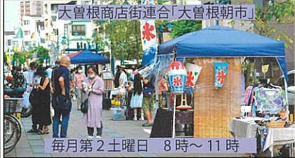
大曾根商店街連合「大曾根朝市」 毎月第2土曜日 8時～11時