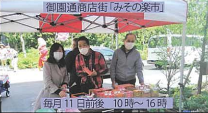
御園通商店街「みその楽市」 毎月11日前後 10時～16時