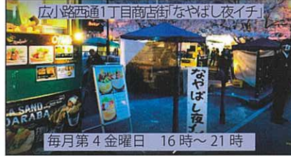
広小路西通1丁目商店街「なやばし夜イチ」 毎月第4金曜日 16時～21時