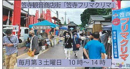
笠寺観音商店街「笠寺フリマクリマ」 毎月第3土曜日 10時～14時