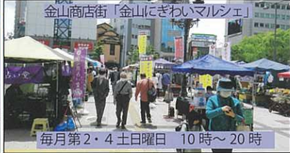
金山商店街「金山にぎわいマルシェ」 毎月第2・4土曜日 10時～20時