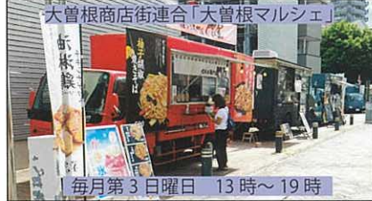
大曾根商店街連合「大曾根マルシェ」 毎月第3日曜日 13時～19時

商店街が毎月開催するイベントを紹介します。 ※新型コロナウイルス感染防止のため開催中止・変更などありますので事前に主催商店街に確認してください。